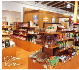
ビジターセンター