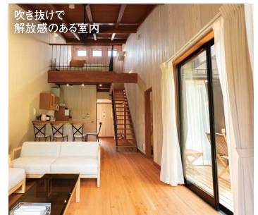
吹き抜けて解放感のある室内